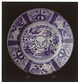
【源右衛門窯】 个染付芙蓉手VOC尺二寸皿 (径約36cm)・・・216,000円