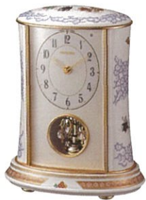
【香蘭社】 个「唐草遊犬の図」クォーツ置時計 (23.1×15.2×高さ29.5cm)・・・216,000円

有田を代表する源右衛門窯、香蘭社、深川製磁など、人気の名窯の代表作品、クラシックコレクション、特別企画品を展示販売いたします。