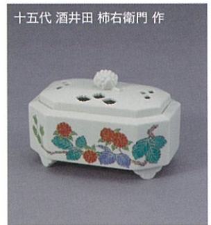
十五代 酒井田 柿右衛門 作 『濁手 蒔文 香炉』