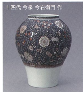
十四代 今泉 今右衛門 作 『色絵雪花墨色墨はじき草花更紗文花瓶』