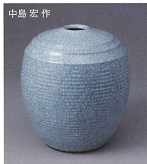
中島 宏 作 『青磁壺形壺』